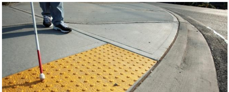
Устройство тактильной плитки