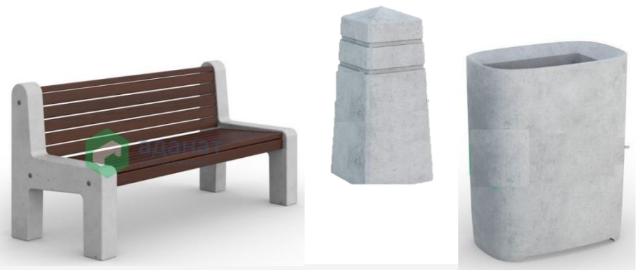
Малые архитектурные формы